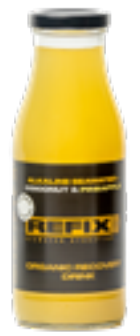
Coco e Ananás