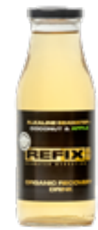
Coco e Maçã